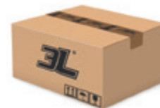
10 dispensadores caja 10 dispensers box